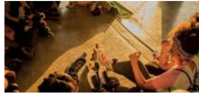
مجتمعات شاملة يسهل الوصول إليها