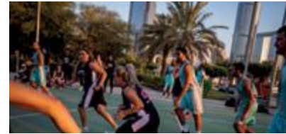
مجتمعات صحية وسعيدة