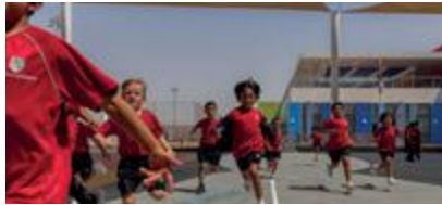
مجتمعات مرنة ومبتكرة